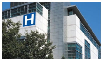
Professions de santé