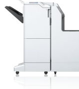
Module de finition 4 200 feuilles empileur agrafeur C12C933041 + C12C933081 Commun aux 2 modèles